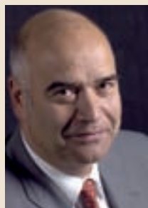
Otto Kentzler ist Präsident des Zentralverbands des Deutschen Handwerks (ZDH) und der Handwerkskammer (HWK) Dortmund.