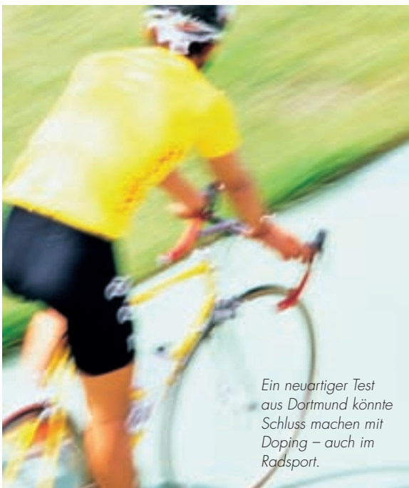
Ein neuartiger Test aus Dortmund könnte Schluss machen mit Doping – auch im Radsport.