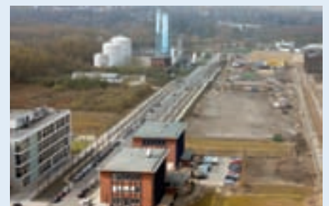
Mit dem Neubau auf PHOENIX West verlässt Raith den Technologiepark nach 16 Jahren.

viel Platz haben wie heute. Im vergangenen Jahr hat die Raith GmbH erstmals mehr als 20 Millionen Euro umgesetzt. Durch den Umzug nach PHOENIX West soll diese Entwicklung weitergehen können. www.raith.de