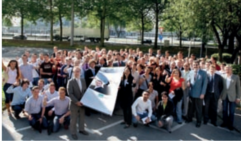
150 junge Menschen haben zum neuen Semester an der FOM Dortmund ihr Studium aufgenommen.