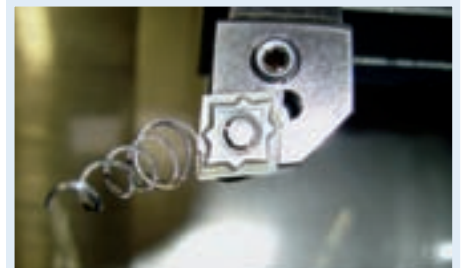
Ein Zerspanwerkzeug im Fertigungsprozess.