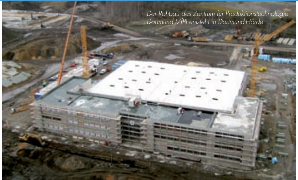
Der Rohbau des Zentrum für Produktionstechnologie Dortmund (ZfP) entsteht in Dortmund-Hörde.