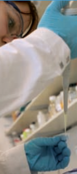
Mit den neuen Finanzmitteln baut Protagen die Geschäftseinheit Protein Biochips weiter aus.